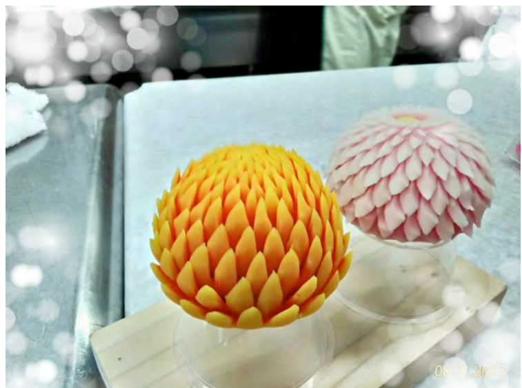
講師の先生作品；はさみ